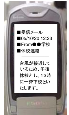
メール受信確認Web画面