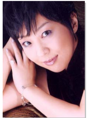
【略歴】 ミス栃木、モデル、女優、レースクイーン、銀座のホステスなどを経た後、「小説新潮」5月号の「読者による『性の小説』」に入選。最近では活動の幅を広げて、若い女性の代弁者、恋愛の教祖、そしてお母さん、という立場からテレビ、ラジオでコメンテーター、シンポジウムでパネリストとしても活躍中。

◆日時：2007年9月6日(木) 14:30～18:00(予定) (受付：14:00～)